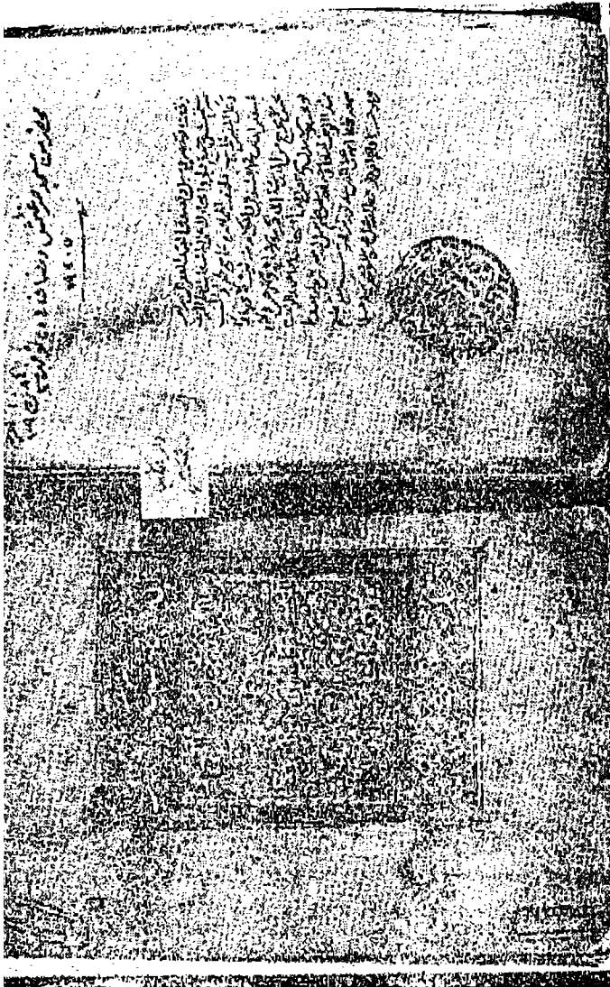
صفحتان من ربيعة شريفة وقلها الأمير صرغتمش بمدرسته، رقم ١٥٠ الكتب. ويظهر على إحدى الصفحتين نص الوقفية وختم التملیكة.